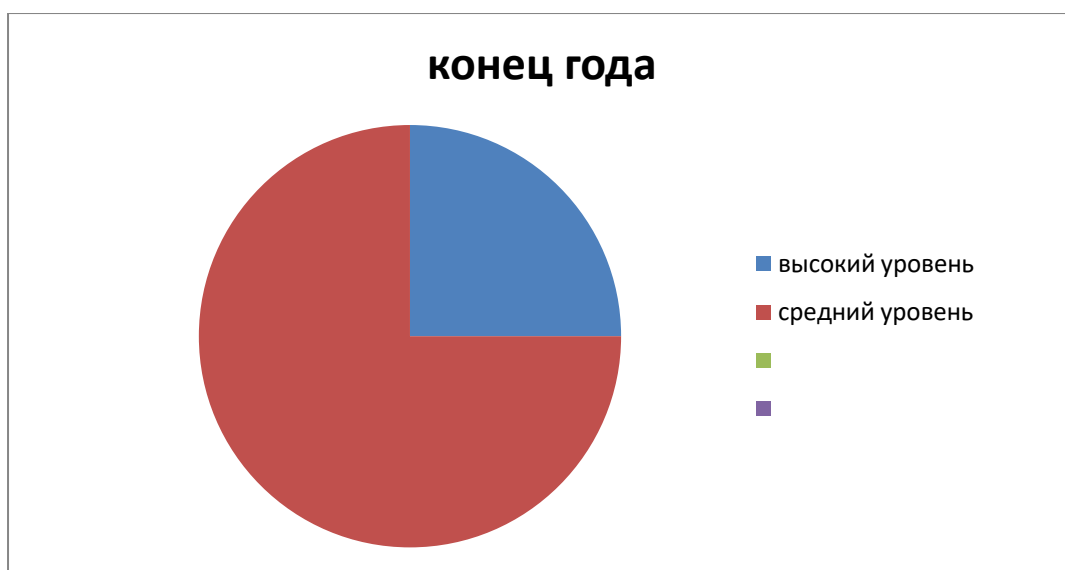
Рисунок 2. Оценка сформированности финансовой грамотности у группы детей по окончании реализации проекта.

В целом мониторинг по группам старшего дошкольного возраста группа показал средний уровень сформированности экономических знаний (средний балл - 2,5).